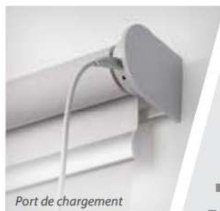
Port de chargement