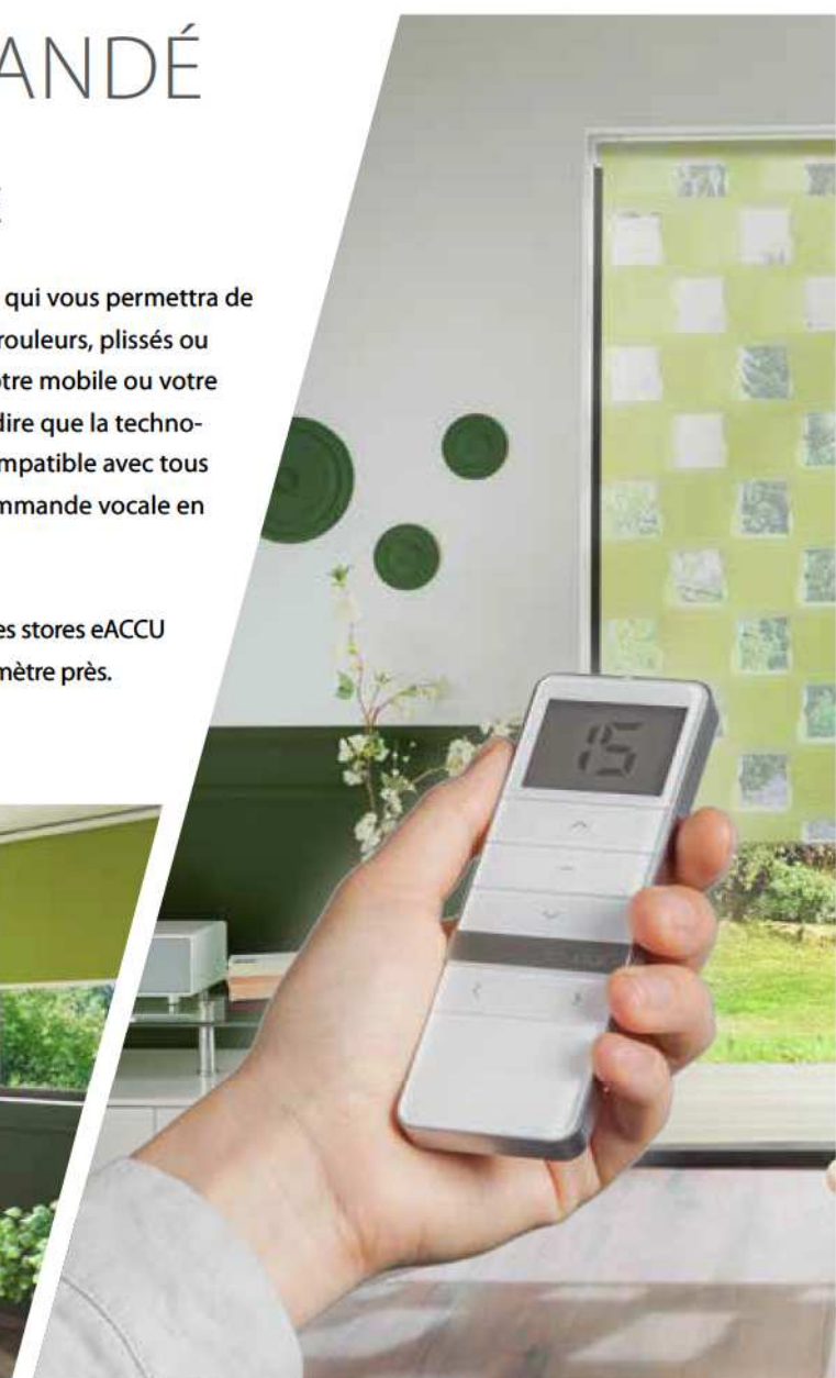
Télécommande 1 ou 15 canaux, dotée d'un écran