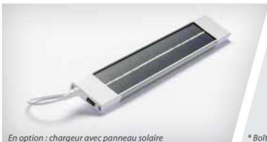
En option : chargeur avec panneau solaire