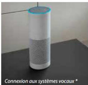
Connexion aux systèmes vocaux *